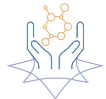
GESUNDES ALTERN/ REGENERATIVE MEDIZIN