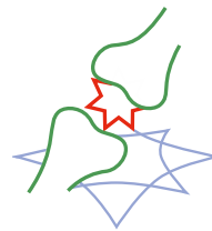
ORTHOPÄDIE/ RHEUMATOLOGIE/ SCHMERZMEDIZIN