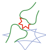
MEDECINE DE LA DOULEUR/ORTHOPEDIE/ RHUMATOLOGIE