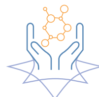
VIEILLISSEMENT EN BONNE SANTE/MEDECINE REGENERATIVE