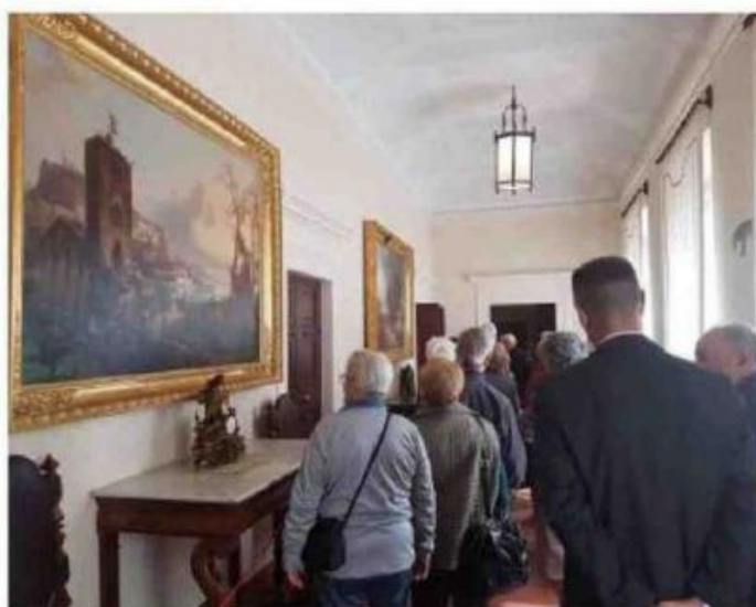
Il progetto pilota lanciato da Lugano prevede di inserire gli over 65 in progetti di arricchimento culturale per migliorare la qualità della vita

"Prescrizioni culturali" a Lugano per il benessere collettivo