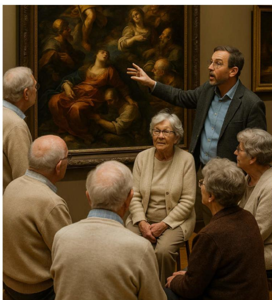
Gruppo di anziani che ascolta la descrizione di un dipinto (immagine generata da ChatGPT)

La Città di Lugano, in collaborazione con IBSA Foundation, l'Istituto di Medicina di Famiglia dell'USI e il LAC, avvia un progetto pilota innovativo di prescrizione culturale rivolto a cittadini over 65 con patologie croniche legate allo stile di vita.